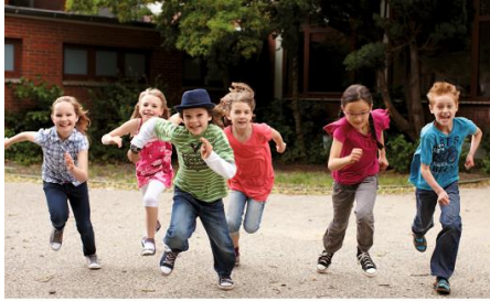
Guter Ganztag für Hamburgs Kinder

Wichtig ist, dass alle Akteure paritätisch eingebunden sind.